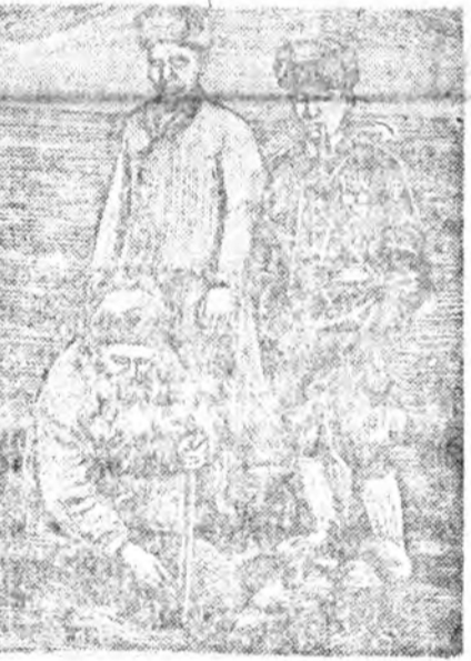
ЗУРАГ ДЭЭРЭ: Сэлэнгын аймагай Селендүмшын сомонот Сталинай нэрэмжэтэ колхозой шарны шалгажа байна.

Аман үгын пропагантын үргэн жалайсые тиймдэ үргэн жалайсайтай холбоотой агитационно ба пропагандистска хуулины советскэ төрөөгөө шийдэхэ программа гэжэ абаталтай табанжэлэй түсэбтэ бөлүүлгэ имагтал ажахын мүнөө байгаа түсэбүүдэ дүүргэхэй ба үлүүлэн дүүргэхэй ашгар хангагдаха болоно гэжэ бүхы ажамхыи мэдэрэлдэ хүргэхэ ябадал болоно.