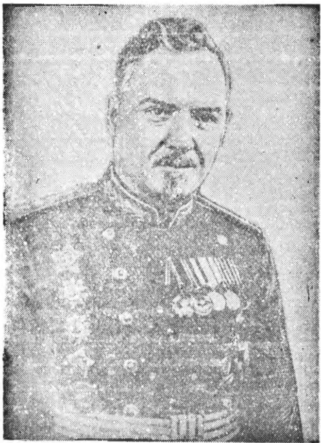
Армийн генерал Н. А. БУЛГАНИН.