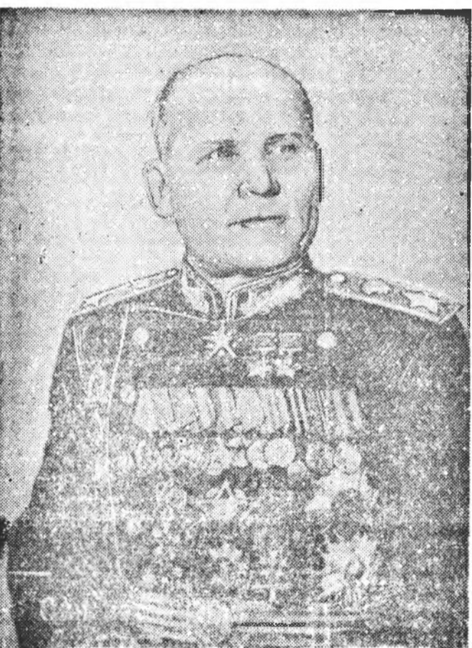
Советскэ Союзай Маршал И. С. КОНЕВ.