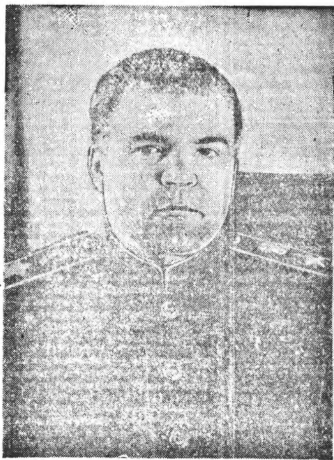
Советскэ Союзай Маршал П. А. МАЛИНОВСКИЙ.