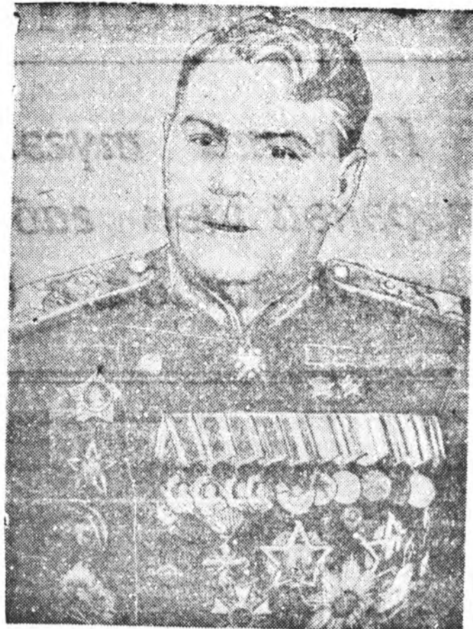
Советскэ Союзай Маршал А. М. ВАСИЛЕВСКИЙ