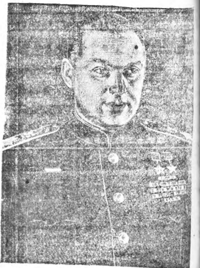
Советскэ Союзай Маршал Н. К. РОКОССОВСКИЙ.