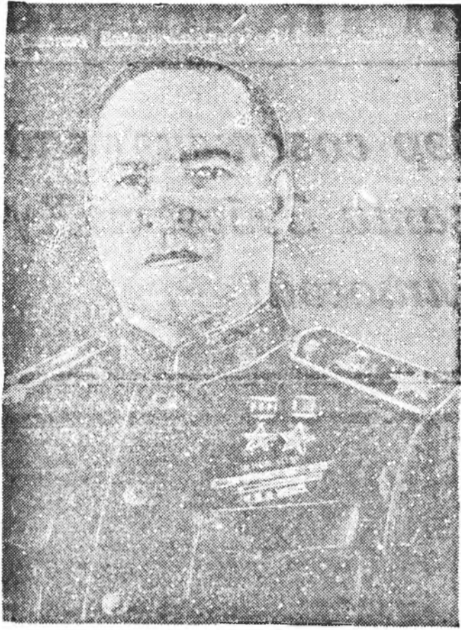
Советскэ Союзай Маршал Г. Н. ЖУКОВ.