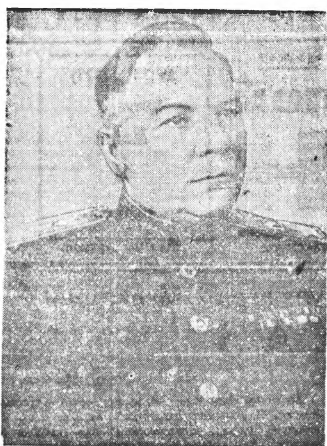
Советскэ Союзай Маршал Н. Е. ВЕРШИЛОВ.