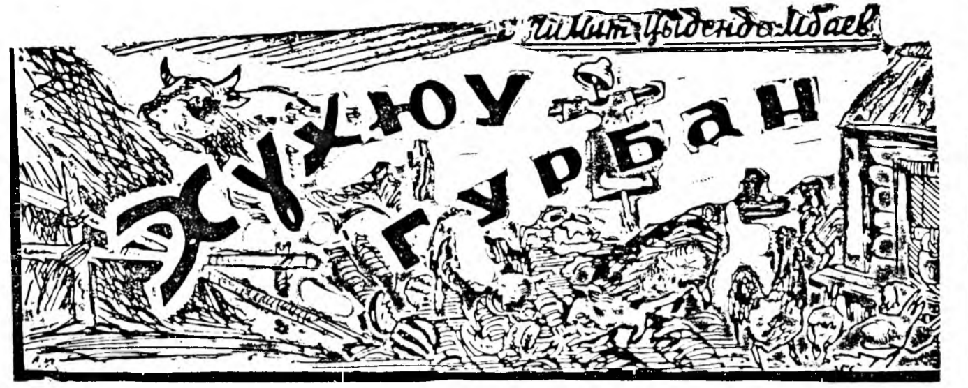
(Нукольна театрта зорюулагдаһан нэгэ үзэгдэлтэй пьесэ)