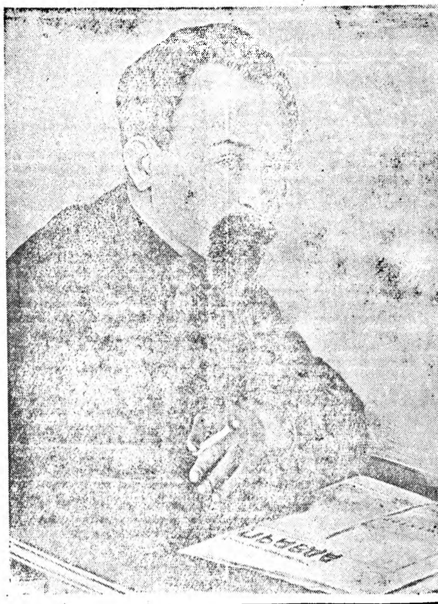
ФЕЛИКС ЭДМУНДОВИЧ ДЗЕРЖИНСКИЙ (Мана бараһаар 20 жэл болонойн ойдо)

Түмэр Замайхидай дунда социалистическэ мурьсөөнэй хүсэтэ дүлые бадаруулжа, тэдэнэрэй Бүхэсоюзна хайндэрые шэнэ улам ехэ амжалтатыйгаар угтахын түлөө шармайн оролдо!