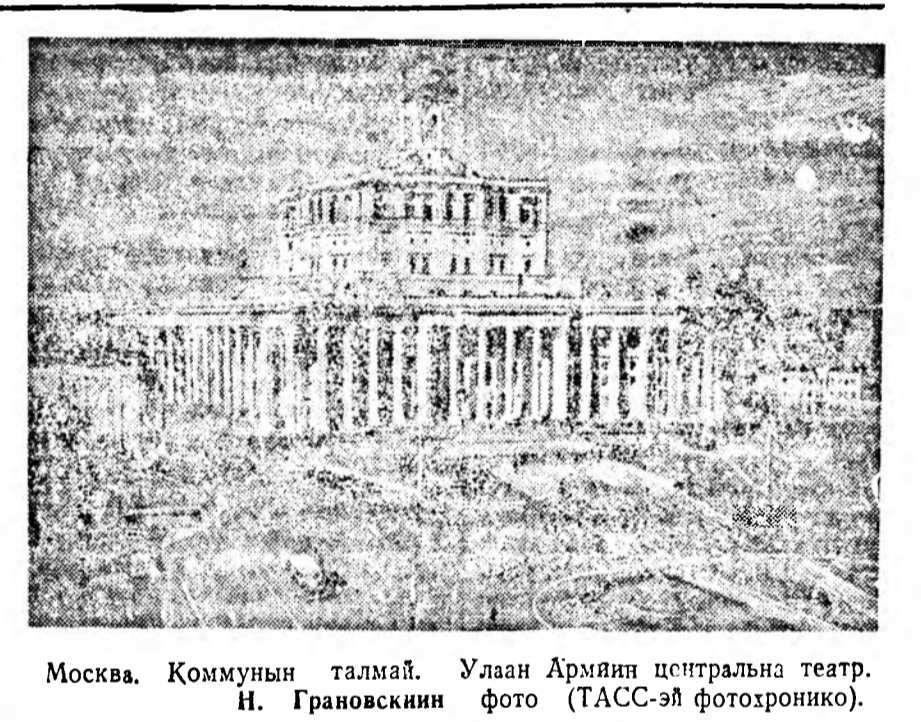
Москва. Коммунын талмай. Улаан Армянн централна театр.

дукова ба ВЛКСМ-эй обкомой секретарь нүхэр Тыхеева гэгшэд оролсоно. Энэ делегаци Амурска флотилин мориягуудта элдэб бэлэгүүдые абаашаа. Театрально-хүгжэмэй училищи струнна инструментүүдые, гүрэнэй заводой комсомолцууд—столой часы, ВЛКСМ-эй обкомойд гармони ба бусад бэлэгүүдые абаашаа.