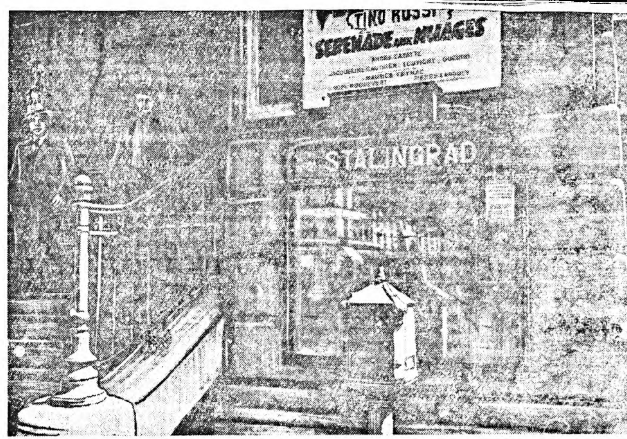
Париж. Метрогой «Сталинград» гэжэ станци.

1946 оной апрель харын эсэстэ комсэлтэй ушардаг байна. Энд баруун социал-демокрадууд болон реакционно католигууд хадаа тусгаар ехэ эрхэгэй байдаг. Шумахер гэгшын толгойложо байһан социал-демократическа партиин баруун хадаа хадаа социал-демокрадууды коммунистнуудтай нэггүүлхэ ябадалда эсэргүүсэжэ, хоер ондоо болохо политикые элита ябуулажа байна.