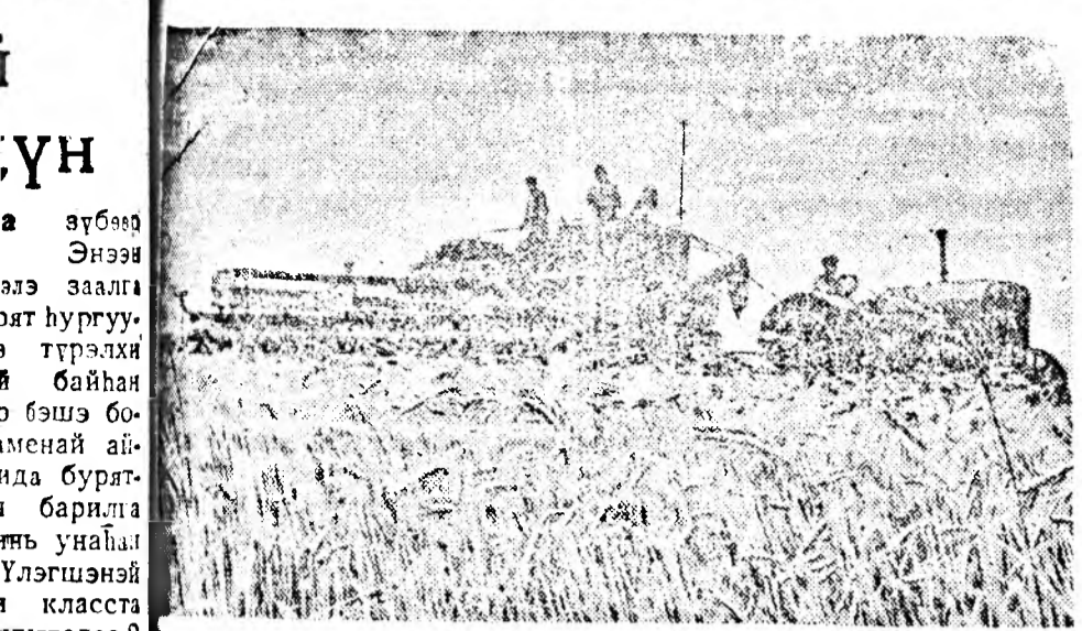
Шивянка МТС-эй трактористнууд Ростовско областын Лениний нэртэй колхоздо ургаса хураажа байна.