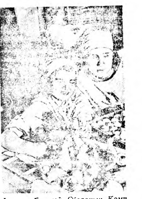
Баяхан Гүрэнэй Оборонны Комитеттэй ба СССР-эй мяха ба һунай ажайлэдэрини Министрствын Улаан тугые үргэлжэлэн хадагалхар Братневскэ шубуунай фабрикийн (Москва) коллективтэ дамжуулагдаба.

Энэ хабар Бичурын аймагта болоһон сомсоведүүдэй ба колхозуудай түрүүлжэшэнэрэй, колхозно счетоводуудай эвбөөр дээрэ, ажалтай тоо бүридхэлэ тухай һайса хэлсэһэн байха юм. Бичурынхид хадаа колхозник бүхэнэй хүдэлжэ олоһон ажалта үдэртые тон наринаар бэшэжэ байха ба тэдэнэй дунгүүдэ һара бүридэ тодорхойлон гаргаад, колхознигуудай хамтын суглаан дээрэ зүбшэн хэлсэхэ гэжэ тон зүб шийдхэбэри гарган байгаа.