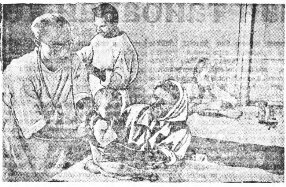
Львовско областин Куликовско району Жовтанцы гэжэ ехэхэн тосхондо мэнэ хая болтор тэндэхи зондо...