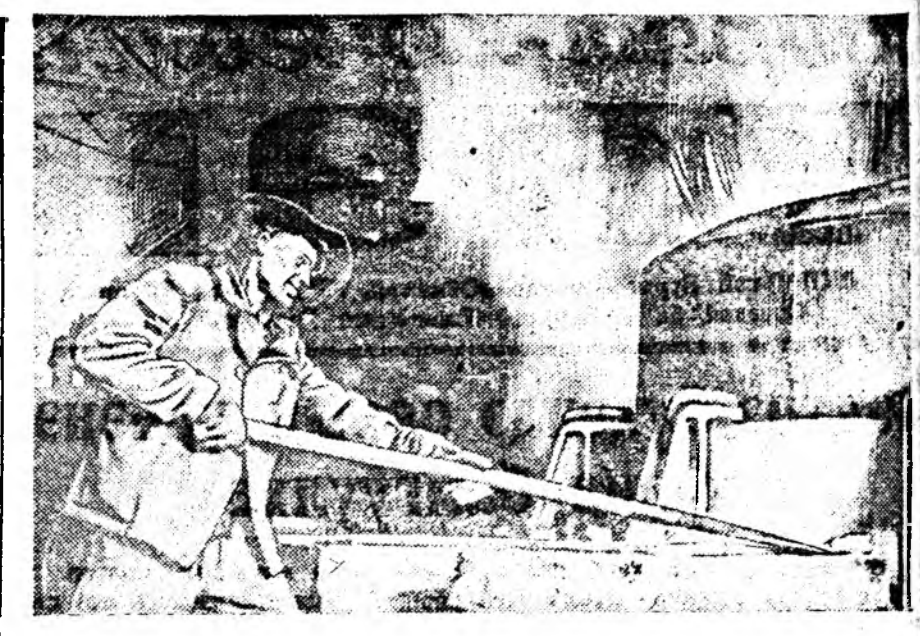
1935 ондо Кольско хаялд арал дээрэ Заполярда тон томо пред- прият мүн болохо—«Северонилеу» гэжэ комбинат баригдажа эхлэлтэ байгаа. Анханда тэндэ тосхон һууриин боложо, хожомш тэрэш Мов- чегорск гэжэ нэртэй город болоо һэн.

Энэ түүхэтэ баримтын агууһа удхашанар юундэ байнаг гэхэдэ энэ хадаа советскэ ниитын байгуу- лалтын дабагдашагүй бүхэ голтой байһание, тэрэнэй мүнөө сагай далхэй дээрэ эгээл бүхэ голтой байһание баталан харуулаа. Ленин —Сталинэй партиин ударилалга дор ябажа социалистическэ общест- во байгуулан ба фашизмн хүсэ- нүүдэ илажа, бүхэдэлхэй дээрэ түүхэтэ илалта туйлаһан советскэ ард болбол өөрингөө хүсэндэ хэл- бэрлшэгүт найданга ба дайнай үндэ- һэй агууһа зорилгонуудыг шийд- хэхээр бэлэн байна. Үйлдэбэрилгын хүсэнүүдэй хүгжэлтыг түргэтэн үйлдэдэг советскэ ниитын байгуу- лалта ба тэрэндэ байһан эмхидхэ- хы хүсэн хадаа шэнэ статиска та- банжалтэй арадай ажахын түсэб- амжалттай дүргэлтын нүхсэл, партийн ба ардай сэгэн мэргэн вождь нүхэр Сталинаар хараалаг- дан, манай Эхэ ороной коммунизм гэжэ дахиха агууһа программыг амжалттай бээлүүлхын нүхсэл мүн болоно.