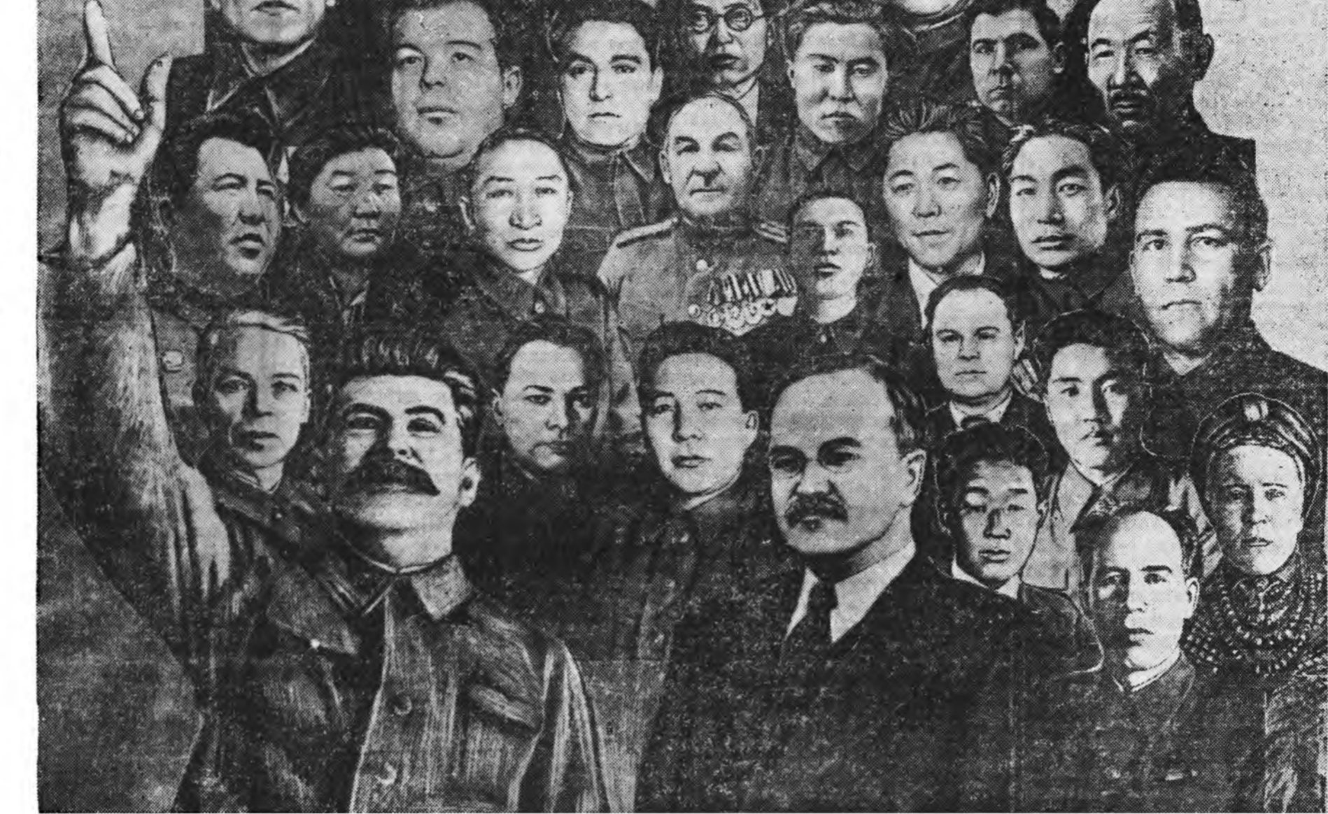
ЭДЭНЭР — МАНАЙ КАНДИДАДУУД

Арадуудай агвчехэ вождэ Иосиф Виссарионович Сталин ба тэрэй ойрын соратник Вячеслав Михайлович Молотов мандаха болтогой!