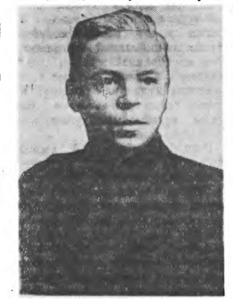
Манай социалистическэ гүрэндэ наука болбол тинмэ хүндэтэ буури ээздэг байна. Иймэ гүрэн хүн түрэлхитэнэй обществын түхэдэ хэ- зээдхыг байгаагүй юм.

Мүн эдэ эмхи зургаануудта уран-хайханай самодеятельность ба үргэн арадай творческо үтсхэл эхэхэнээр хүгжөөгдэхэ еһотой. Манай деревни-д естественна-научна эрдэм ухаани-ын үргэнээр нэбтэрүүлхэн шухала.