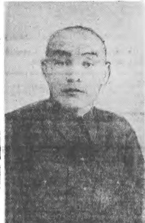
Монгол АССР-эй политическэ, экономическэ ба культурна хөгжэлтэдэ шэжэ амжалтанууд туйлагдан байна.

Нүхэд депутатууд! БМАССР-эй институциин 31-дхи статьягай болон Бурят-Монгол АССР-эй Верховно Советтэ хунгаха хунгалтнуудыг эрхилхэ тухай Диримэй дахи статьягай «д» пункттын үндэр, Бурят-Монгол Автономно Советскэ Социалистическэ Республикын Верховно Советдээр Республикын Мандатна комисси болбол Верховно Советдэй депутатуудай тэ тлөөлөгчтэ шалгажа үзэбэ. Мандатна комисси болбол депутатуудта хунгагдан канлидадуудыг инстращида оруулхан тухай хунгалтын Центральна комиссинин үгэ-протоколнууд болон хунгуулин ороонхой комиссиннуудай голосованин протоколнуудыг хаража үзэбайгаа.