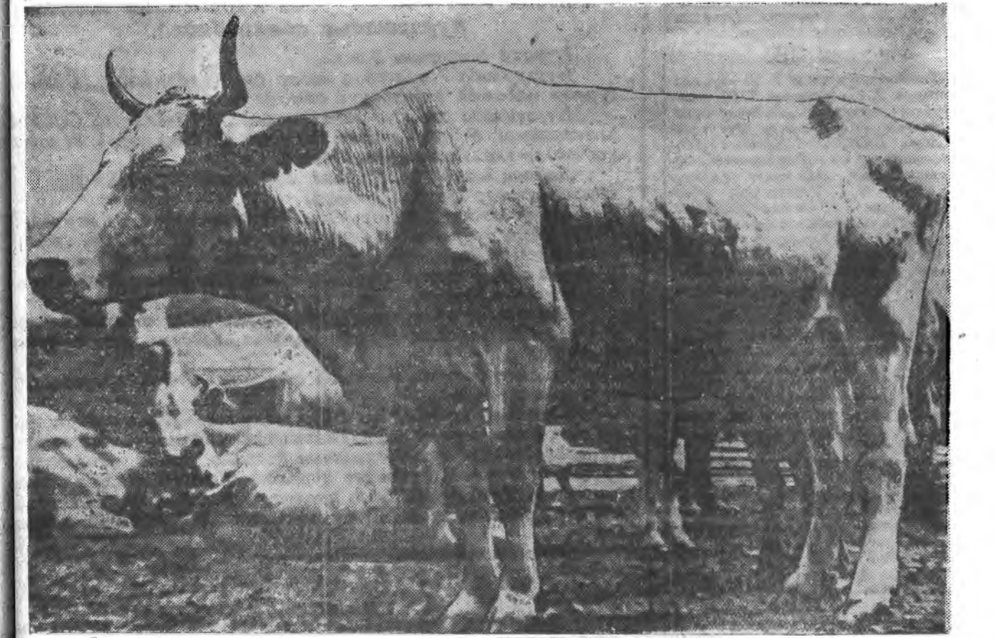
ЗУРАГ ДЭЭРЭ: Хүдөө-ажыхын Министерствын Юреогэй туршалгын станцины мал бэлшээжэ байна. Наада таладань һү үсэд «Дика» үсөөн.