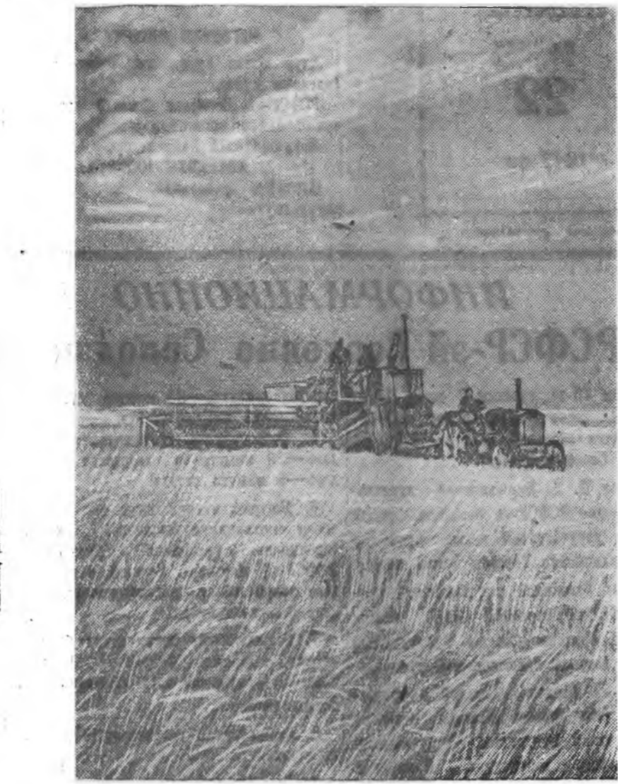
Узбекскэ ССР. Кашка-Дарьинскэ областин «Юлдаш-ака» гэжэ колхозой тарваган дээрэ орооһото культурануудай хурялга хөгдөжэ байна.