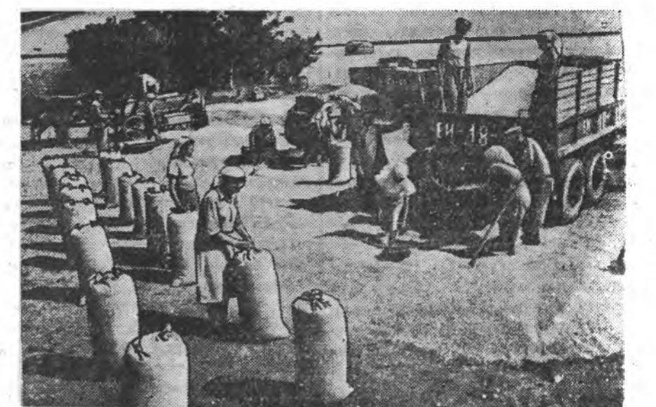
Ставропольско хизаар. Селдато-Александровскэ районной «Искра революци» колхоз ороһото культурануудай хурялгыне амжалтатгайгаар дүүргэбэ, гүрэндэ таряа тушааха түсэбтэ июнын 20-до дүүргэбэ. ЗУРАГ ДЭЭРЭ: «Искра революци» колхозой ток дээрэ.

Бичурын аймагта колхозуудай зарим хубинь гүрэндэ таряа тушаалгада мүнөө хүртэр ороодүй шахуу байна. Мүн энэ-нэ аймагтай хүтэбэрлэхы органууд хэ-нэа тиньэ хожомдон колхозуудай ажал хэрэгтэйгэй хайнаар таялсажа, тэднэй гэгээлжэ дабажа гараха тушаа тодорхой хэмжээ абахын ороно таряа тушаалгын графигаа хадаа хүдэлмэрилшэды байһанай шалгалтанин тайлбарлаха ханаатай байдаг. Аймаг дотор уржаса хурялгын ба таряа тушаалгын нимэ нэгэ жэлдэ бэшгэ абажа байһан ушар хада аймагтай организацинуудай зүгшөө таряахурялга ба тушаалгы тодор-