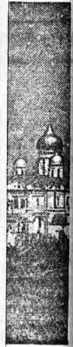
Ийна, Газар айхса юм, ондоо лийна байна. Энэ сьеддүүг Совет үтэй Сталинскэ ай фото. (ТАСС).