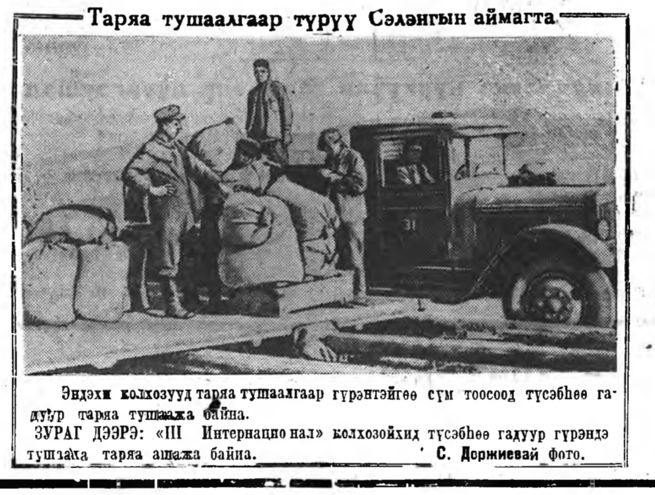
Эндэхэ колхозууд тарья тусаалгаар гүрэнэтгөө сүм тоосоод түсэбөө гадуур тарья тусаажа байна.

Актюбинскэ область 1947 онойгоо ургасанаа тарья тусаалгын гүрэнэй түсэбье гаргеше татагаргүйгөөр болорхоонь урда сентябрин 22-то 100 процент дүүргэе гэжө нүхэр Сталин, Тагда мэдээсэбди. Түсэбөө гадуур гүрэндэ таряа тусаалга үргэлжэлээр.