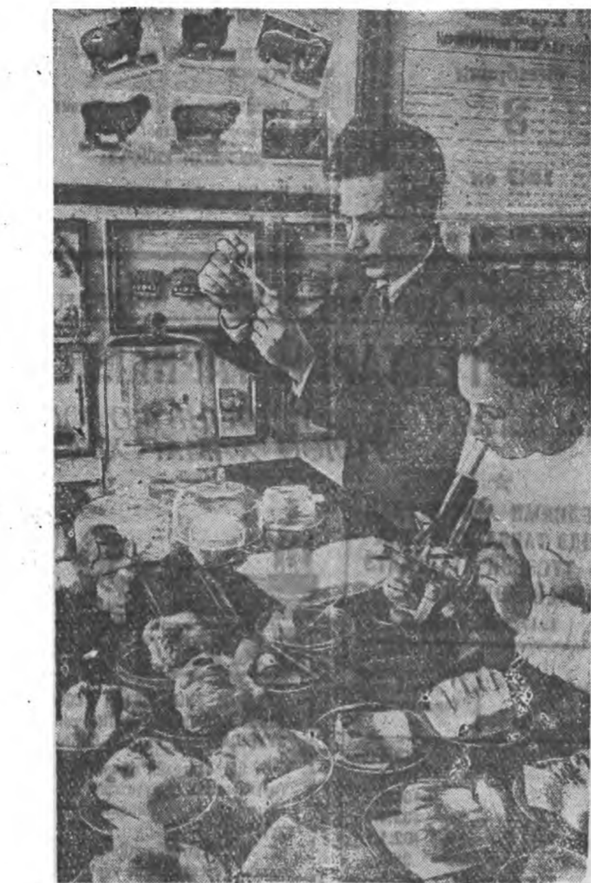
Новосибирск, Сибирск малажалай наут на шижалалгын институт болбол Алтай-... дахи ноодо байтай хони үсхөөрилхэ...