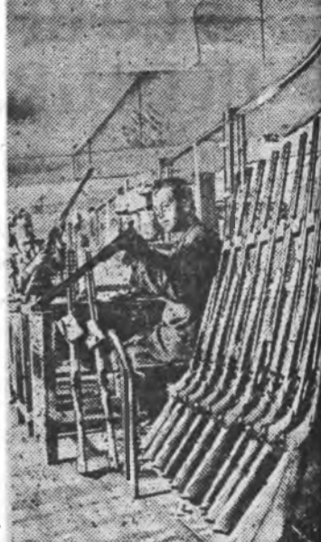
Удмуртска АССР. Хахад жэл өмскэ мотозавод ангуушадый барилга...