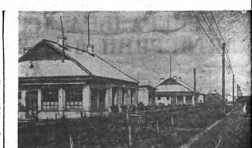
Алтайска хиазартахи тракторна заводой поселогто хоер квартиратай 128 кой, нэгэ квартиратай 70 гөрнүүдэй барилга ахлэгдэе. ЗУРАГ ДЭЭРЭ: баригданаһан шавэ гөр нүүд.