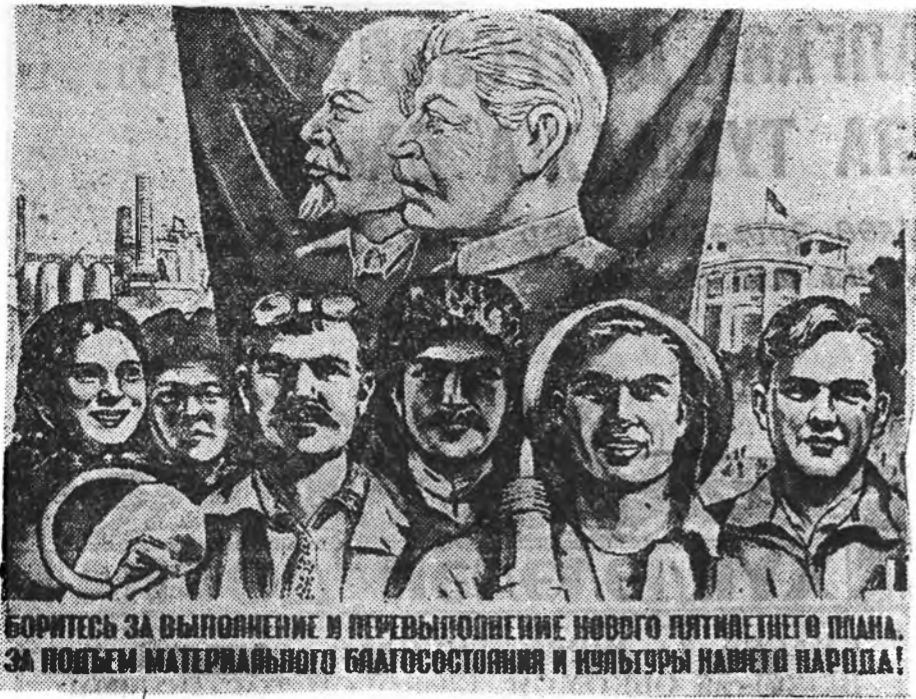
БОРИТЕСЬ ЗА ВЫПОЛНЕНИЕ И ПЕРЕВЫПОЛНЕНИЕ НОВЫХ ПЯТИЛЕТНЕГО ПЛАНА. ЗА ПОЛНУЮ МАТЕРИАЛЬНУЮ БЛАГОСОСТОЯНИЕ И ПЬЯНЬСЫ НАШЕГО НАРОДА!

★ Уранзурааша Н. Ватolina зурага, «Искусство» гэж хөблээй гаргаган плакат.