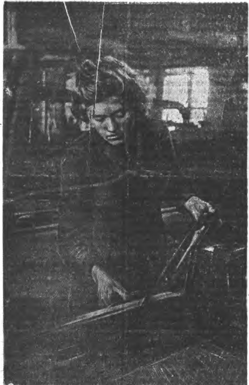
Улаан-Удмы сэмбик фабрикын коллективтэй дунда сэмбэ нэхэлгын дүй дүдлэмжэ...