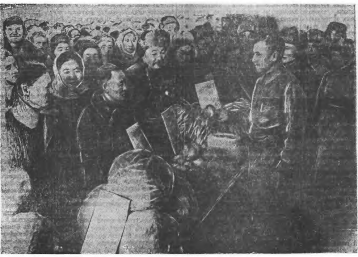
Загрийн аймгай хүдөө ажыхын выставкнэ...