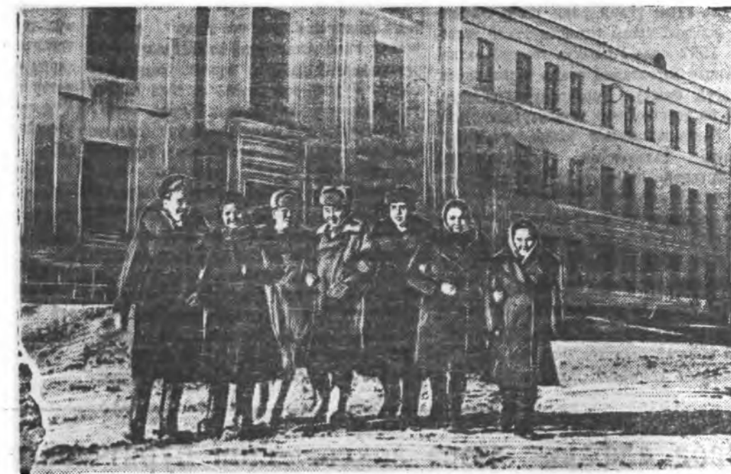
Советскэ засагай Үедэ тон олон дээдэ ба дунда хургуулинууд манай эндэ байгуулагдаа. Тэдэ ажалта арадай үрэ хүгүгэй хуража байдаг. Зураг дээр: Бурят-Монголой Дорж Банзаровой нэрэмжэтэ пединститудай студентер.

Манай оройн аравууд болбол туг дор тогтоогдон абтаһан Сталинска Конституцийн үдэрэ байһан байна.