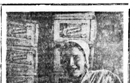
ЛЕНИНГРАД. Ленинградскэ тобо өөхтэй комбинатай коллективн үн-гэргэгшэ жэлэйндэ программа болзоһоон үрид дүүргэд, жэлэй дүүрэтэр түсэбнөө гадуур 5.000 гарын тоно маргарин ба хэдэн зуун тоно наран сэсэгэй тобо гаргаа.

Бурят-Монгол АССР-эй Министруудай Совет болбол адуу мориды олошоруулха гүрэнэй түсэбдэ үлүүлэн гүйсэхдэгшэн колхозуудай түрүүлэгшэнэр ба КТП-е даагшадые мянга-мянган түхэригөөр Министруудай Советдэй диплом бэриулагатай үнэмтөө тусуура.