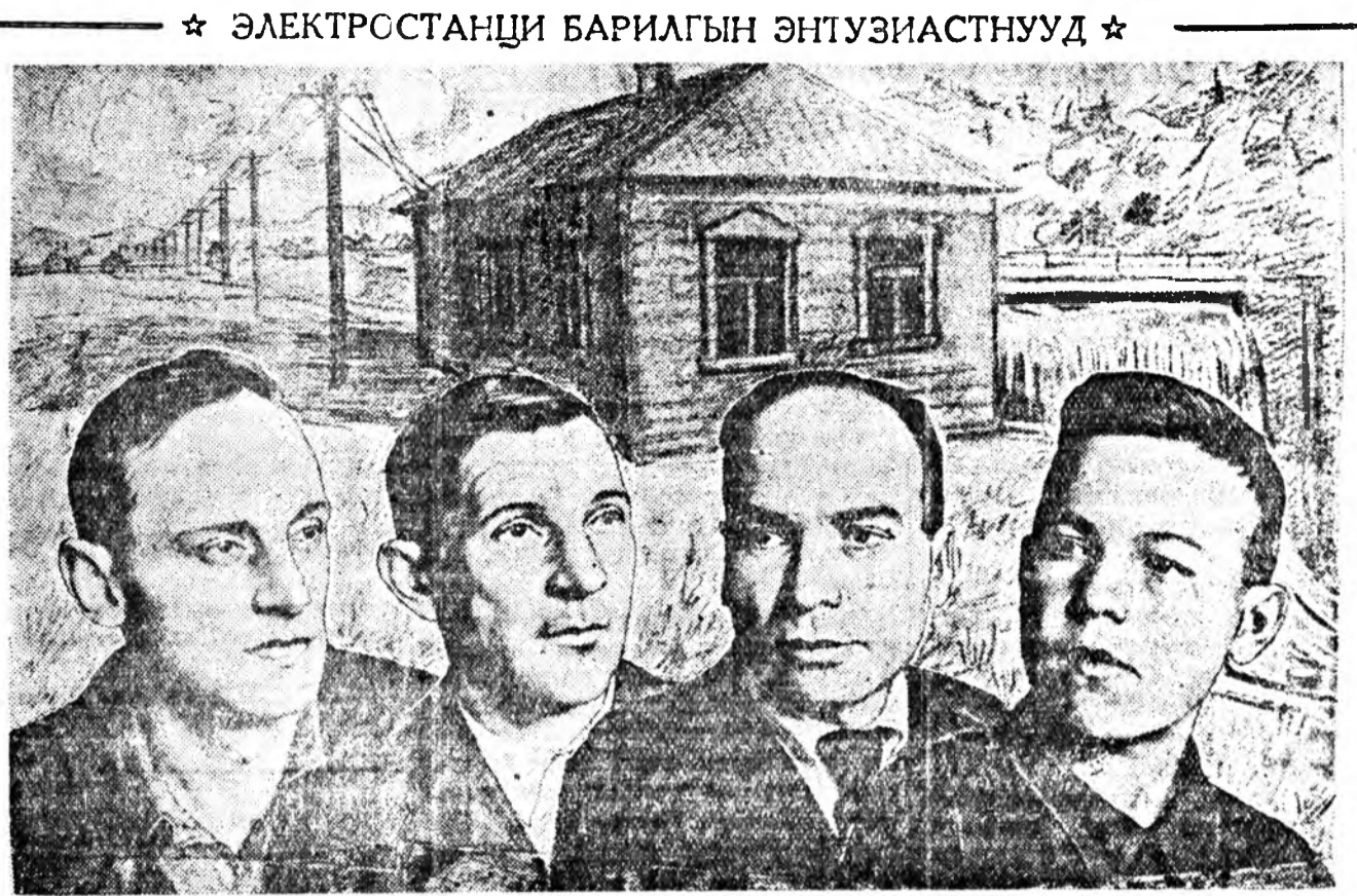
Дүрбэн даруу ба простой нүхэдье манай энэ зурга дээр харамт. Эдэнэр—Бурят-Монгол хувьд нутагуудье электривчестын галаар...