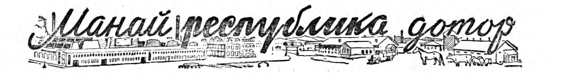
(Манай корреспондентнуудэй мэдээсэлнүүд хээ)

Урда тээн Москвабаа Хабаровск хүр-гэр үдэрен сууха соо, бусахалаа «СССР-Д—1378» самоледой экинжэ хада нидэл-гын рейсые 2 гашүү дахин хорообо. (ТАСС).