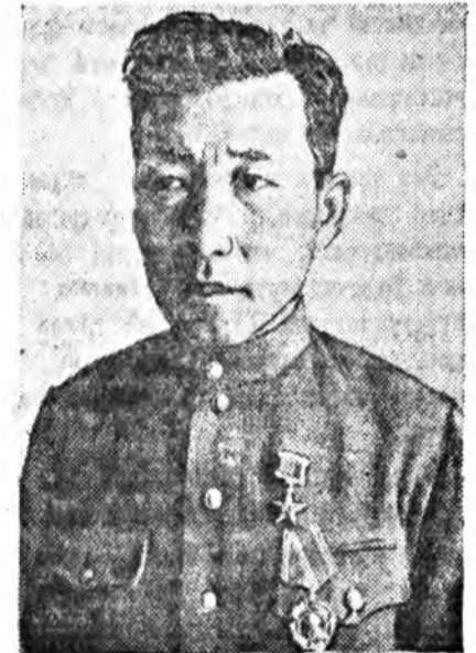
Социалистическэ Аналай Герой Н. Б. РИНЧИНО.