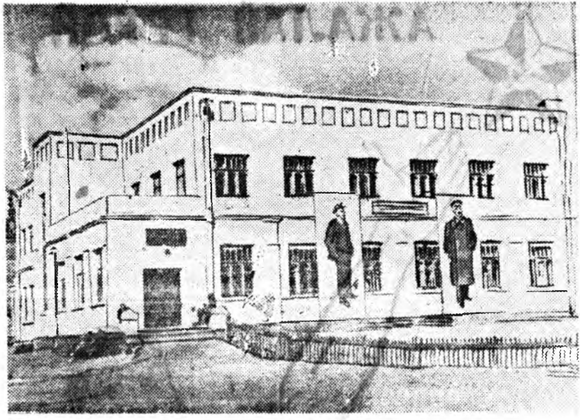
ЗУРАГ ДЭЭРЭ: ВВП(б)-гэй Городекой райкомой партийна кабинет.