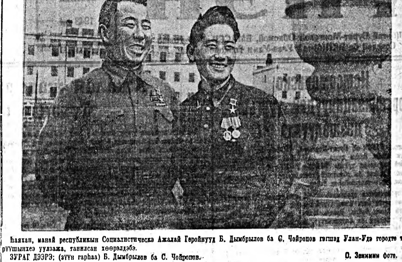
Баяхан, манай республиканы Социалистическэ Ажалай Геройнууд Б. Дымрыков ба С. Чойропов гэгшэ Улан-Удэ гөрхтө түрүүшнхэе уулзаха, тагилсан хөөрөлдөб. ЗУРАГ ДЭЭРЭ: (зүүн гарһаа) Б. Дымрыков ба С. Чойропов.