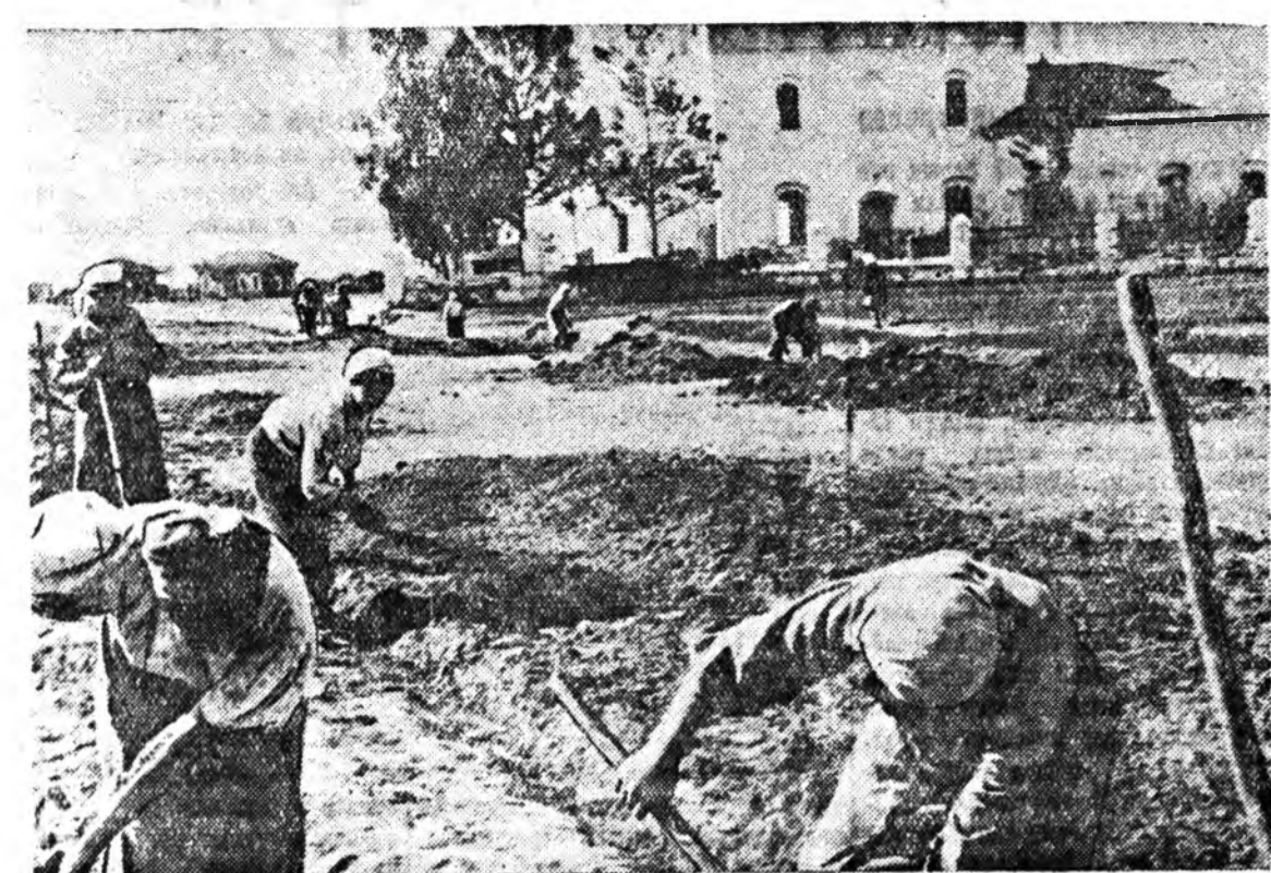
Мүнөө Үедэ манай республика дотор хэргы барилгын нара үнгэргэгдэжэ байна. Энэ харын түршэ соо олонхи аймагуудга нилсэд эхэ ажал бүтээгдэжэ, шөнө харгынууд, хүүргэнүүд барилдана. Ураг дээрэ: Байкало-Куларын аймагай «Путь Сталина» колхозой колхознигууд харгы барилгада хүдэлмэрилжэ байна.

МТС-эй директоре политическэ талаар орлогтын нимэ буруу хүдэлмэрилхэ дунда политическэ ойлгууламжын хүдэлмэрингөө тэдгойлоо еһотой хүн аад, харин МТС-эй хүдэлмэрилхэ штрафовалжа аажалуулаха метог хаанаһа олоо гэшдэ? Ойлогшоһотой.