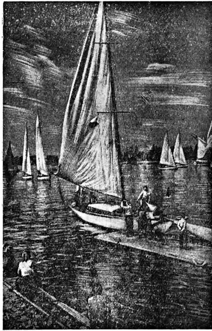
Ленинград. ВЦСПС-эй Яхтклубта зунай навигацийн түг хийлгэгдэ. 150 паруса сунанууд уйнада табигда. Сезоний нээлгын хүндэлдэдэ ахтаар ба шөвртбатуудаар урилдмалга болов.

БМАСР-ийн 25 жилийн ойн үрдэсн мүүрсөөндэ оросоһон республикын бүхы финансова органууд гүрэнэй бюджет дүргэлтын түсэбүүдэ —налог сугуулгаар—108, страховой түлбэрээр—132, мүнхэ вөөсөлгөөр—104, гүрэнэй олзоор—100,3 процент дүүргээ. Республикын финансова органуудай дунда Бхтын аймгай финансын хүдмэрлэгшэд түрүүлүү түрүүлүүлжэ, түсэбэйгөө дээдэ тээ 2 миллион 898 мянган түхэрлэгтүшэеэ байла. Сэлэнгын, Мухаршөрөй аймгууд элдэб түлбэрийгүүдэ суглуулбарин ба гүрэнэй олзонгоо хуульчаргаар эрхлэгддэг.