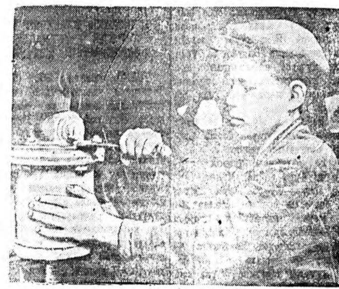
Улаан-Удэ станцийн вагоно дөногой худалмэрилэһэдэй дунда...