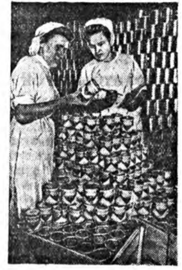
Вологодено область, Суюнско бунэй заводой коллектив үнгерхөн таба Нарын хугасаа соо татад жэ-лэйнэ программы бөөдүүлжэ, тусөөнө галуур 854 мянган бан-ка нүхэй консервнууды үйлдэ-рилэн гаргаа.

тийна өргөнжиш (секретаринь нүхэр Очиров) социалистическэ мурьсөө бодотгоор хүтээлээр ба төрөнөй дунгуудыг таан хонг бүри гаргажа, холхонигуудай үб-лэдэрин суглаанууд дээрүүр зүб-шөн хэлсэл явадаг хангаар бай-гаа. Мурьсөөндө түрүүлбөн ферма, бригада, аэроноузда колхозой прад-лени ба партийна организациин дамжуулгын Улаан тут баруулаг-далаг юм. Нардаа хоер удаа ха-нын газар, зургаа дахин дайшхы туулаанууд гаргагдаг байна.