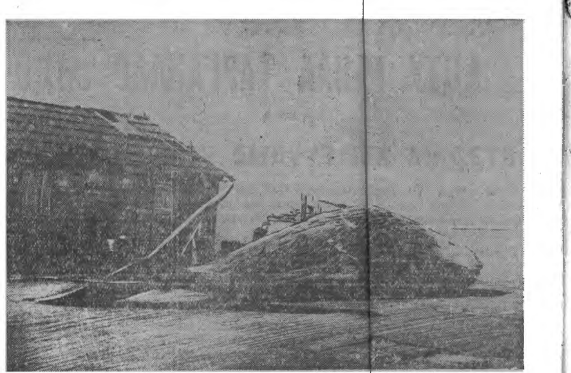
ЗУРАГ ДЭЭРЭ: Буриньска аралн уул. Итуртн аралдах «Басга» гэжэ китозавол. Заволой палуба гөмө 22 тоннын кит-капалот харуул аглана.

РЕДАКЦИН АДРЕС: г. Улан-Удэ, ул. Ленина 26. (ТЕЛЕГРАФНА АДРЕС: Улан-Удэ, Унэн) ТЕЛЕФОНУУД: отв. редак. ола — 23, АТС — 1-80 зам. редактора — 3-23, отв. секретаря 3-23; отделов: партийной комиссарской комиссии — 4-52, культуры и быта, промышленности и транспорта — 4-52; писем грядущим, внутренней информации и переводов — 4-52 (2 зв.), объяв. зний — 2-64 (2 зв.). Для мандатарных дел — 4-52.