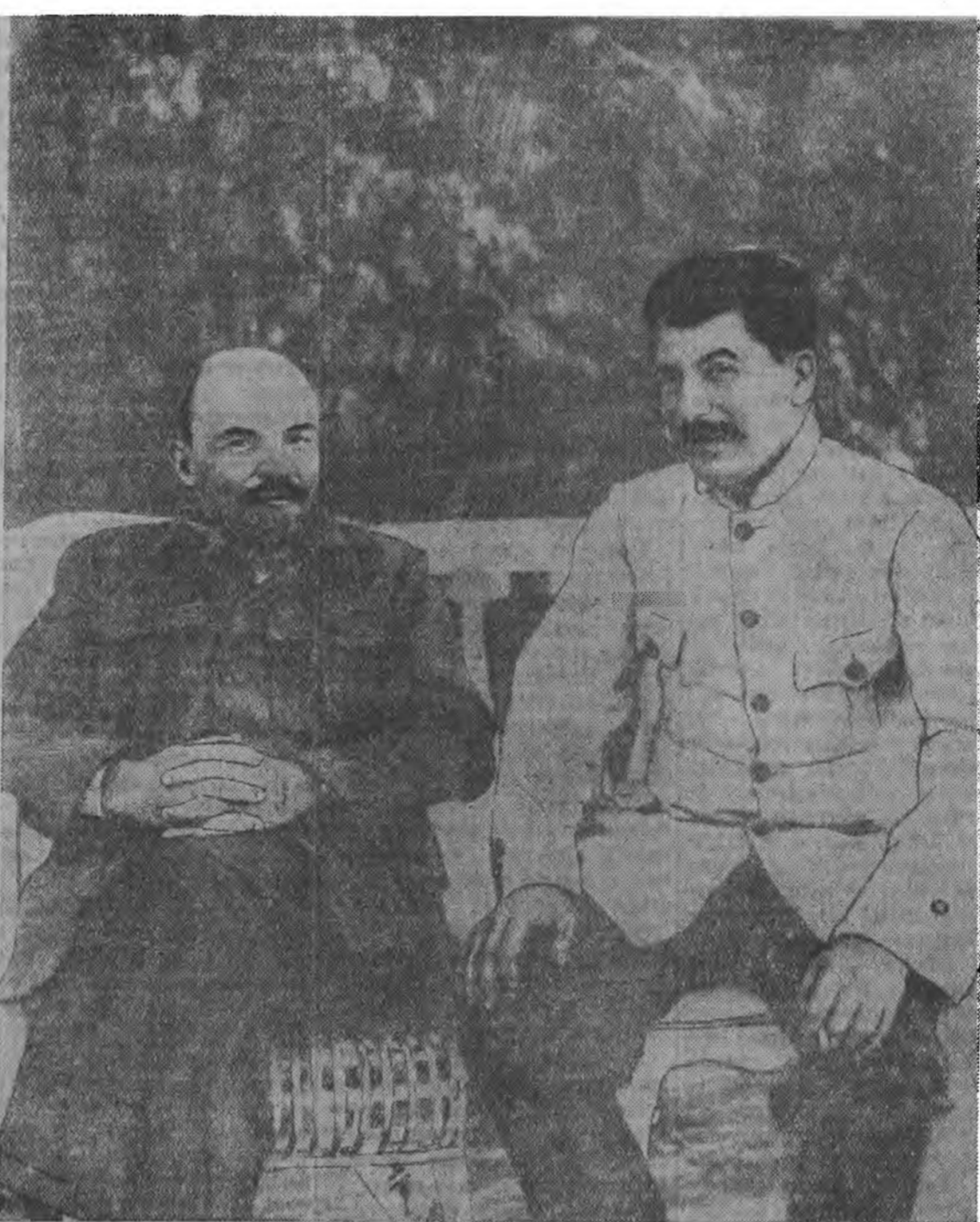
В. И. Ленинэй нүгшлэһинэ хайшо 25 жылэй ойдо (1924—1949 он). ЗУРАГ ДЭЭРЭ: В. И. Ленин И. В. Сталин хоер Горхидо байна (1922 он).

Угөөдөр, январин 20-до Комсомолой XIV областной конференци нэгдэхэнь. Үгэдэе, республикын комсомолой ажабайдалда айхалтай эхэ собын мүн болохо байна. Республикн соомолой ажабайдалда айхалтай эхэ собын мүн болохо байна. Республикн соомолой ажабайдалда айхалтай эхэ собын мүн болохо байна.