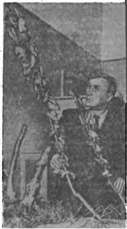
Биологическа наукагудай катедри В. Ф. Ферманов академик Н. А. Максимов хураалгай дор тухай хичмисэ ауйлнуудтар ургалтын процессыг хураалгай арга хэрэглэбэн байна. Угтэрш хабар 500 шахуу зөлө молонгудай үндэһөнүүд дурсагдагы хичмисэе иу парадаар нэбтэрүүжэжэ буулагдабан юм. Ингэжэ буулагдаһан лигнүүд шавсаарт эрхм найнаар ургана.

Холбооной комитет болбол элдэб олон ороноудта эб найрамдалай түлөө хүдэлмэрэ үргэлхээр оролдох ба өөрынгөө хүдэлмэринэ үргэлжэлүүлхэ гэбэ.