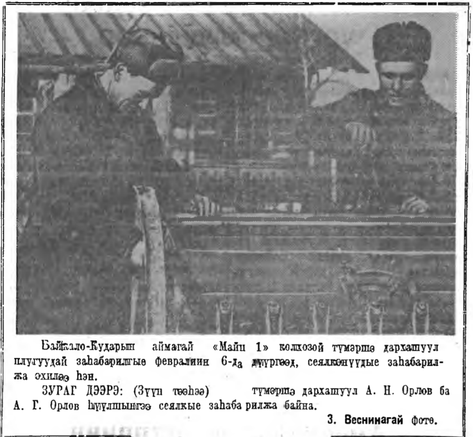
Байгало-Бударын аймагай «Майн 1» колхозой түмэрше дархамуул...