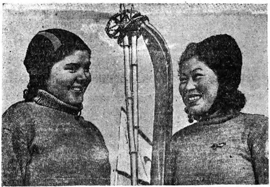
Бурят-Монголой пединститудай физика-математическа факультетий үбөлэй спортивна сезон соо саваар ба конькигаар уридаанай мурсысөө нүүдтэ хабаадсалса, эрхим амжалтангуулы туйлаан байна.