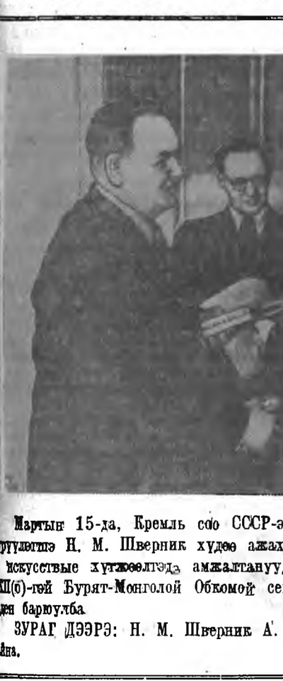
Мартын 15-да, Кремль соо СССР-эй Верховно Советэй Президиумой

Манай партийна организацинууд-нитэ-политическэ хүдэлмэриие эм-хидхэхэ талаар олон жэлэй-баян дүршэлтэй болоо. Тэрэ-баян дүршэлөө, политическэ хүдэл-мэрин олон янзын формо болон-арга методүүдые хабарай тарил-гын үедэ хүсэд хэрэглэхэ гэжэ-партиорганизацинуудай нэрэ-хэрэг мүн.