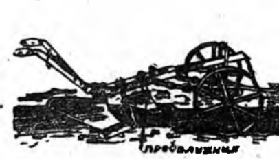
Предплужнигыгэ зүбөөр зохоожо табяад байхада тэрэнэй отлодог хушууниин плугтай корпусой анзаһанай үзүрһээ 20 сантиметр тухай зайтайгаар урагшаа гараһан байха ээргэ-тэй. Тинхэдэ плугтай анзаһа-най хушуунаа 0,5—1 санти-метр тухай досоо тээгүүр яба-ха ушартай юм.

Предплужнигтай плугаар газар һайнаар хахалха хадаа тэрэниие зүбөөр тааруулжа та-биһан дээрээ дулдыдаха боло-но. Хэрбээ буруугаар табяа хадаа хэрэгэ гутажа болохо