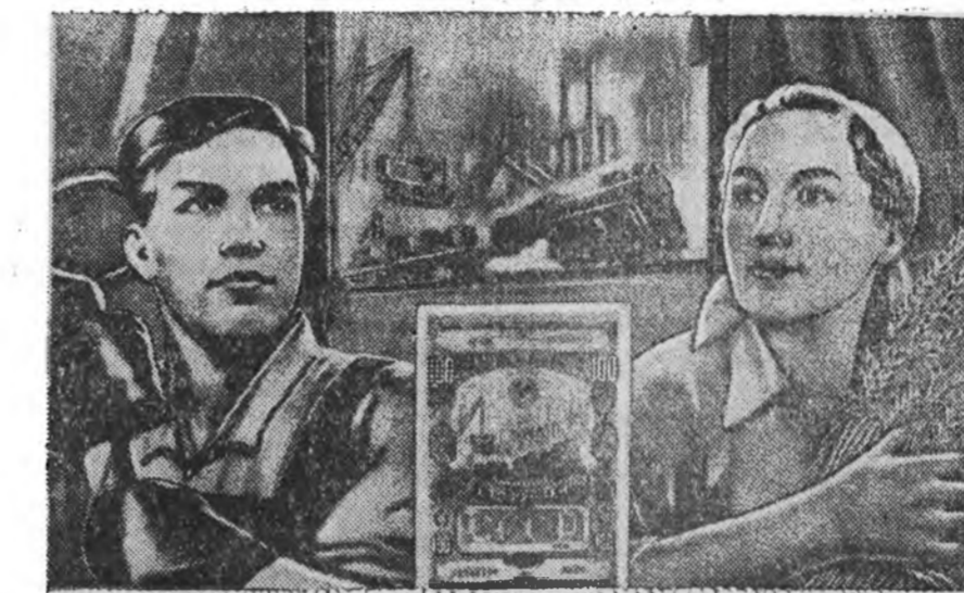
Хүдэлмэришэд ба таряшад! Шэнэ урьһаламжа болбол манай оройниие бүри баян, бүри хүсэтэй болгохол!

Предплужнигтай плугаар газар һайнаар хахалха хадаа тэрэниие зүбөөр тааруулжа та-биһан дээрээ дулдыдаха боло-но. Хэрбээ буруугаар табяа хадаа хэрэгэ гутажа болохо