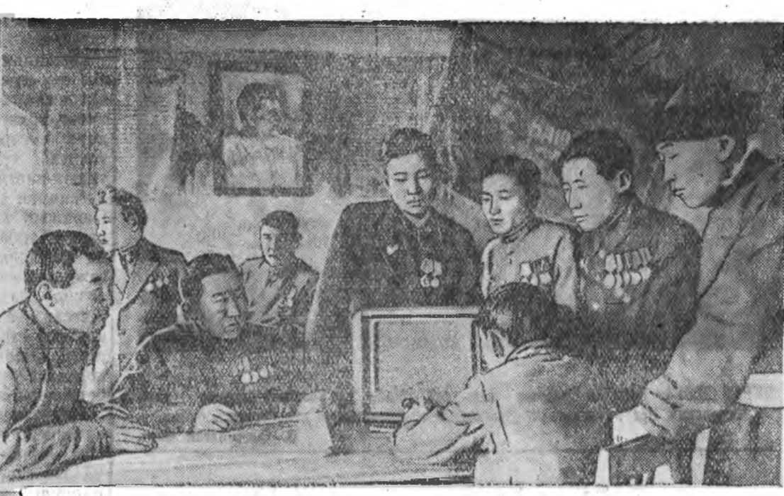
Ивонгийн аймагт «Улаан Оронго» колхозой улаан бузан соо колхознууд сүлдтэй сэтгэл гэгээтэнд ба номуудыг уншаха, радио шагнаха аргатай байдаг.