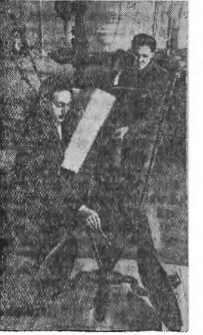
ЗУРАГ ДЭЭРЭ: овоондой ажлын науц-чонжогтын институттай бүтээн барсан овоондой семжээ.