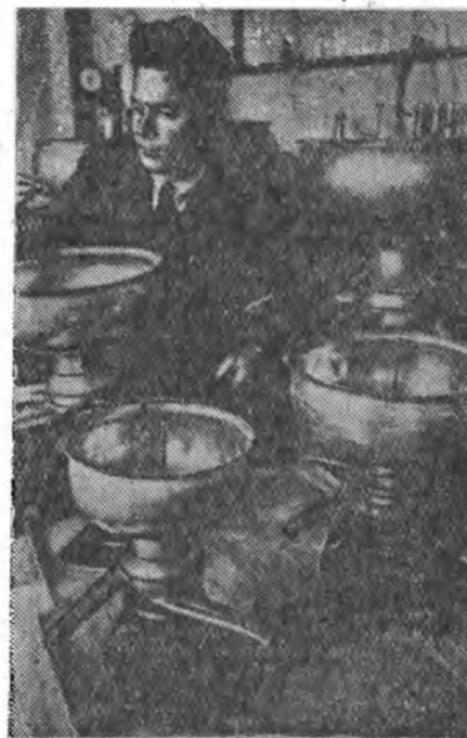
ЗУРАГ ДЭЭРЭ: хүдөө ажалгае механизацилгын науцно-шажалгын бүжөөжөнө на институттай бүтээн баргаһан шэнэ сепараторнууд.

Энээнине бөлүүлхын түлөө юу хэжэ хэрэгтэй? Зунай үдэ һу, тоно, зөөхэй тон түргэнөөр гашалдаг, гутадаг байна. Энээнэй шалтагаан хадаа ехэнхидэ гэр байра соо ариг сээрнэе сахиха дэггүй, сээрлэгдэггүй амһартада үнээ һаадаг ябадал дээрнээ гарана. Тинхэдэ һүн соо элдэб хоротс микробууд орожо болохо юм. Тинмэ туладан һаалишан бүхэн үнээдгэйгэ хүхэ дэлэнгые найнаар угааха, өөрөө сээрээр хубсалха, һаахынгаа урда тээ гараа угааха, һу хадгалдаг амһартанууд ба гэр байрые тон сээр байлгаха ёһотой. Зарим ферменүүдэй ажалые ажагалада, һаалишад үнээдгэйгэ дэлэн угаадаггүй, үнээдье һааха таарамжатай сээр байра түхээрэгүй байһан ушарнууд тохболдоно. Үнээдэй дэлэнгые муугаар харууланхын дээрнээ һу һаалишан хэмжээн бага болодог ба үнээдэй хүхэний үбшэнгэй болохон дээрнээ тэднээр байрагуй түршэ болодог юм. Иимэ ушарнуудье гаргашагүйн түлөө һаалишан бүхэн тэмсэхэ ёһотой. Нэгэ үнээдэй дэлэн угааһан уһаараа нүгөө үнээдэй дэлэн угаажа болохогүй. Ушарын халдабартай үбшэнгэй байгаа һаан бусад үнээдтэ таража болохо байна. Тинхэдэ үнээдэй дэлэнгые угаахада таарамжатай байхын тула дэлэнгын тойруулаа ноонын хайшалха юм. Хурса үзүүртэй хайшаар хайшалжа болохогүй, харин түс-