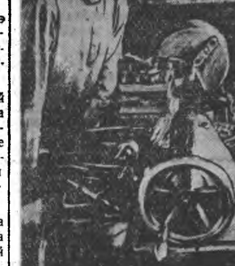
ЗУРАГ ДЭРЭ: Халааж соогоо 2—3 воржо дуургагэр Гашейн МТС-ей эрхим токарь Фетис Казаиников.