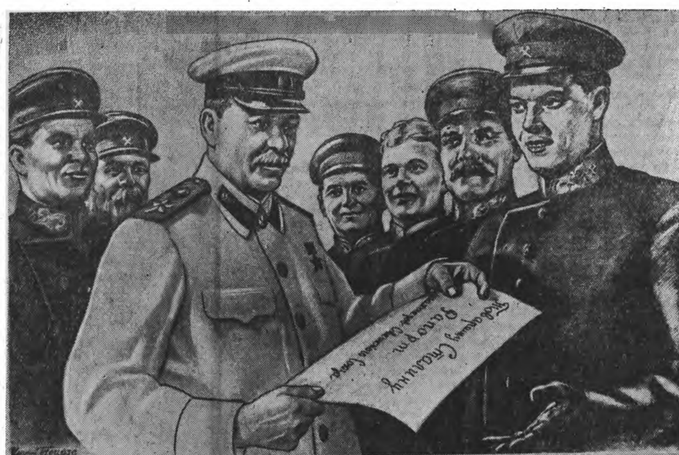
ШАХТЁРНОУДАЙ ЭРХИМ ХАНИ НҮХЭР АГУУЕХЭ СТАЛИН МАНДАХА БОЛТОГОЙ!

Шахтёрой Үдэрөөр дашарамдуу- лан манай шэн габыата шахтёр- нуудта амар мэндэ хүргэе!