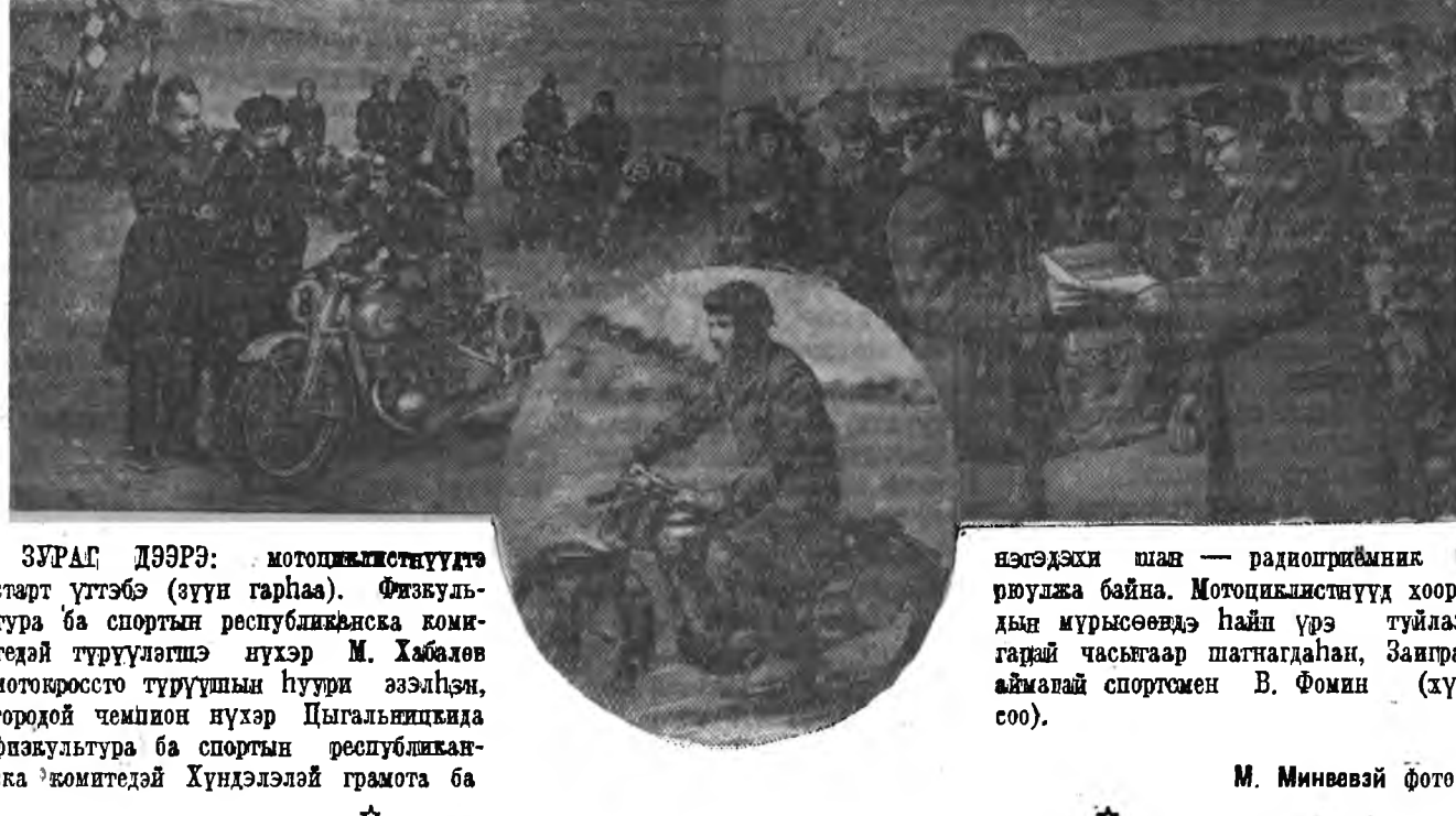
Эршүүлэй урилдаан илангаяа фенирхолтой байба. Тэдэнэр ИЖ — 350 мотоциклээр ехэ бэрхшээлтэй 100 километрын замын гаталаа. Трассай түрүүшын километрүүдтэ Цыгальникий ба Кушавин («Ажалай резервүүд») хоёр хоорондоо урилдөө. Түрүүшын хоёр тойролгодо Кушавин түрүүлжэ ябаа. Тэрээнһаа 3 минутаар нүүлгэжэ старт абанан Цыгальникий миин 40 секундаар гээгдэжэ старт дээрэ эрбэ. Гэбшье, тэрэний саг 33 секундаар урилдажа Цыгальникий