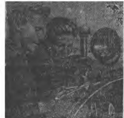
Гашейн МТС-эй залуу трактористуудай доорноо социалистическэ мурсысөөн үргэвөөр дэлгэрээ...

Хэжэнгын МТС-эй директорые политическэ талаарн орлогшо.