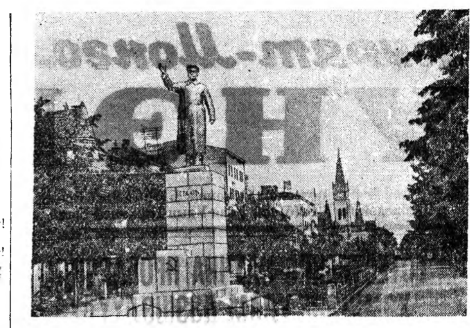
Украинска Советскэ нэгэһэн гүрэн дотор украинска арадай хамтаран нэгэ- дэһэн хойно 10 жэлэй ойдо. ЗУРАГ ДЭЭРЭ: Закарпатска областин Мукачево городой Сталиной нэрэмжэтэ улицы.