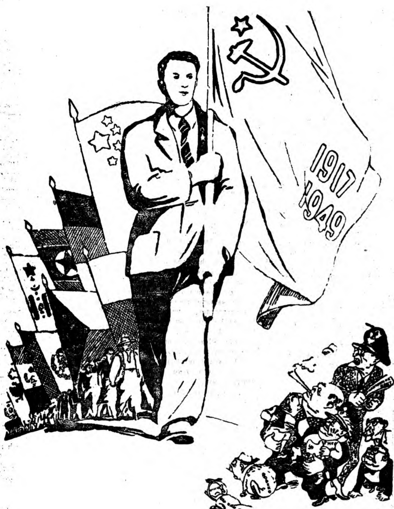
36 найрамдалай түлөө тэмсэгшэд Эмхитэй доржунаар урагшаа давшана. Тэрэнэй хүртэй гэгшэһынэ дуулаа, Тэшхэн үймэг лэ харата дайса. Эбэй, эрхын, ажалай түлөө Эрлэхэг тэмсэгшэд урагшаа давшана.