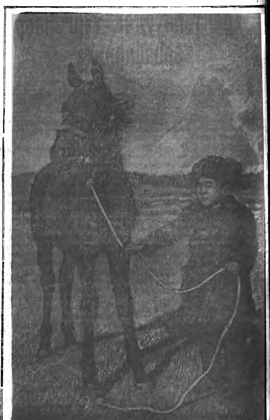
ЭДИР ХОЕР Зингийншье эдир, Зэрининшье эдир, Бухинду дошхон хүлэгдэн Булгин гүйсээ зэбханай, Булуу шамбай хууһуун, Бухайһаан айхын тэмдэггүй, М. Миневэй фотогэрт.

США-гэй дотоодын хэрэгүүдэй министр Круг энэ оной декабрин 1-һээ тушаалһаа гараха тухай мэдүүлбэ. Газетэнүүдэй мэдээснэй ёһоор, Кругта Трумэн дурагүй байна.