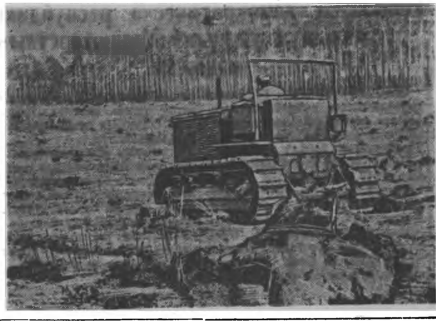
Нисовскэ область. Модо тамгалгын Черкаска станци модо тархаа ажалы- гээ түсбөыс хоёр дахингаар үлүүлэн дүүргэе. ЗУРАГ ДЭЭРЭ: Дайнай үдэс немед- ко-фашистка эзэмлэгтэгээр тархал- гата хуушан модоной түсүүлүүдтэ үн- дэһөөрөө хуулагдажа байна. Эндэ шэ- нэ модо тарилгата юм.

—Статья соо хэлэгдэнэн барин- танууд тодорбо. 1949—50 онуудай луралсалал жылда Юрөөгэй сомон- до, тэрэ тоодо республиканска мал- ажалай түрэлгын станцида бурят- монгол үзэг бэшэгтэ арад зонин лургалга эмхидхэгдэбэ.—гэжэ, Сэ- лэнгын аймагай гэгээрэлэй таһагай инспектор нүхэр Л. Санжиева ма- най редакцида мэдээсэбэ.