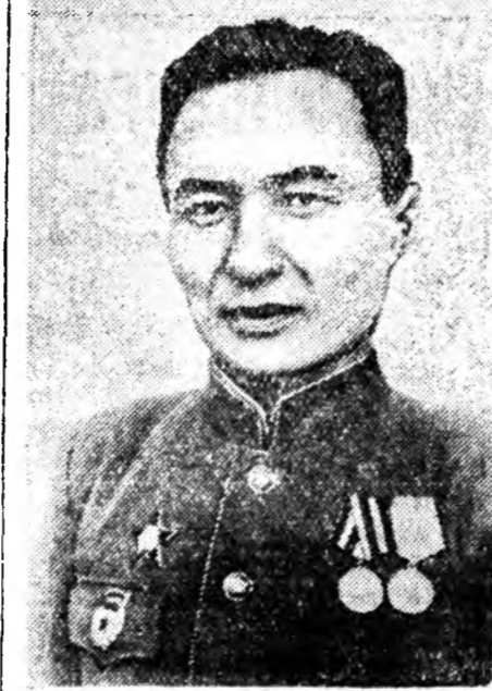
Бяхтын № 2 автотранспортна конторо ашаа шэрлэгэр энэ жөлэй түрүүшн кварталай даалгариине 157 процент дүүргэжэ, БМАССР-эй Министруудай Советэй дэргэдхи Автоуправлени дотор түрүү нуури эвэлхэн ба бүхэсоюзна шанга кандидат болгодохоор зуурпалагдхэн байна.

Хүдэлмэришэдэй болон албаагтадай зунай амаралтын үе болобо. Наяар дунда ба дээдэ нургуулинуудай турагшалай зунай каникул эхилхэн. Тэдэнэр курортнуудта ба санаториуудта, амаралтын гэрчүүдэ ба лагернуудта ошоно амархааа гадна, зариманинэ эскурса, туристска походуудта гараха ехэхэн хүсэлэнтэй.