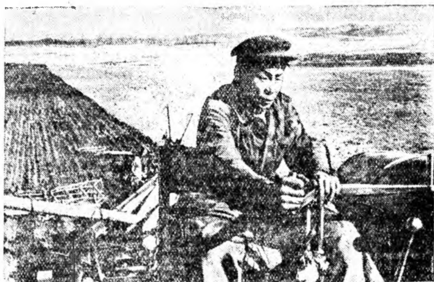
Сэлэнгын аймагтай Сталинай нэрэмжэ- тэ колхозой поли дээрэ тракторнуудай моторууд үдэр хүнигүү хүнхинээ...