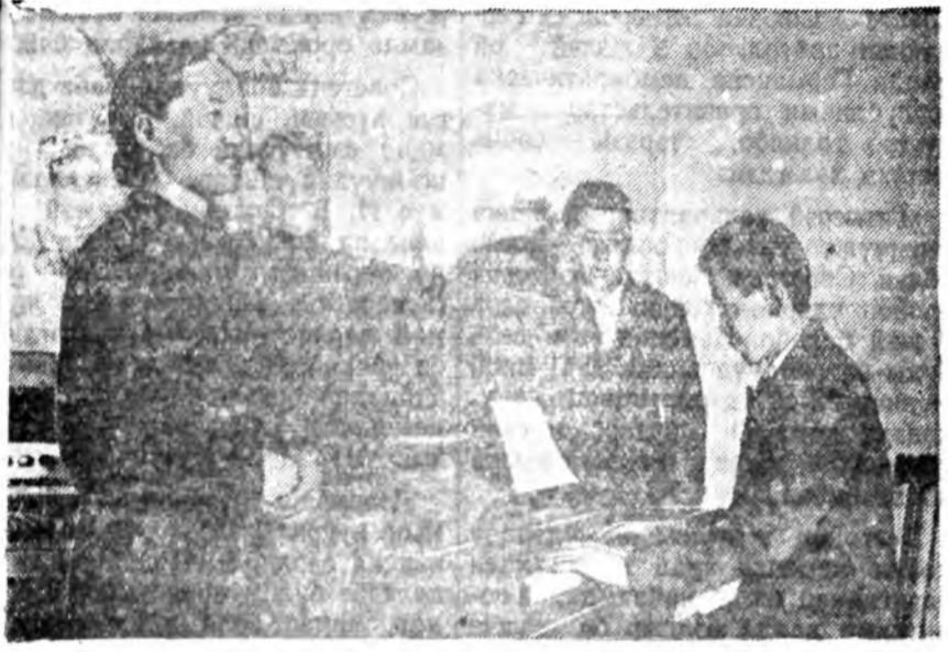
1. Электривчээр нооно хайшалаа. 2. Колхозой клуб соо.

Ярууны аймагтай Молотовой нэрэмжэтэ колхоз хадаа манай республикын түрүү колхозуудай нэгэн юм. Хүдөө ажыхын энэ артелиин тогтоонхоо хойшо мүнөөдөр хорин жэл гүйсэбэ. Тиин тус колхозой хорин жэлдэ туйлахан амжалтанууд тухай зарим тэдэ материал доро толилолдо. Эдэ материалууд хадаа колхозно байгуулагтын хэды ехэ хүсэтэй байхан тухай, тэрэнэй ашаар малша бурядуудай ажибайдалай үнд-хөөрөө найжархан тухай хэлэнэ.