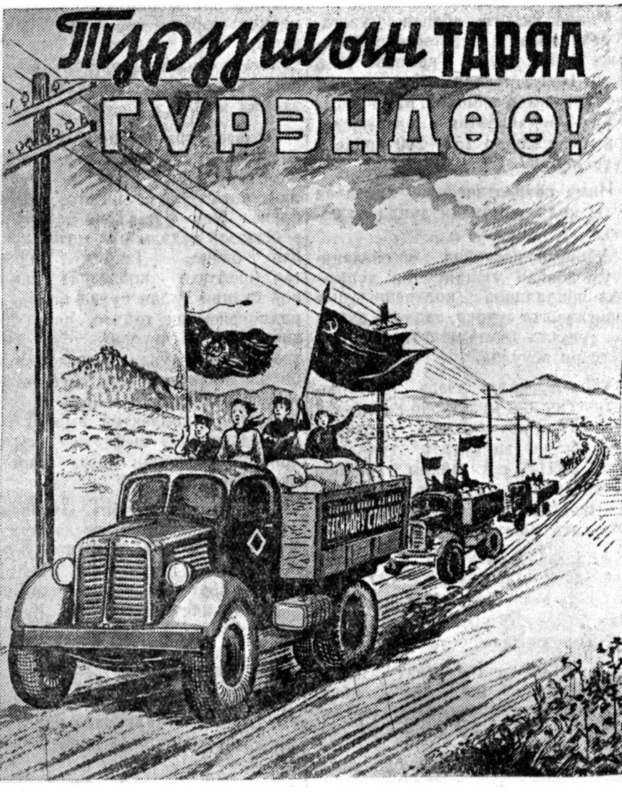
Уранзурааша Ф. Балдаевэй зураг.