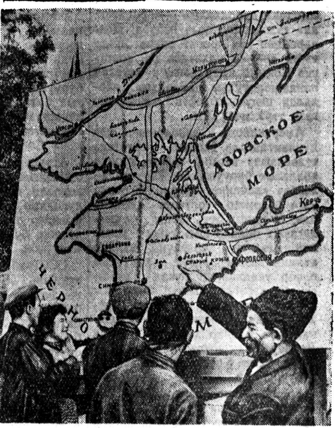
ЗУРАГ ДЭЭРЭ: Хойто-Крымскэ каналы схемэ.