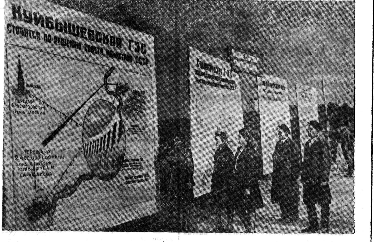
Винницийн ажалда Волга, Днепр ба Аму-Дарья дээрхи барилганууде угаа ежээр һониргоно. Барилдажа бай-гаа гидроэлектростанцинуудай хүсэе, электрэнерги дамжуулха лининууде, ерээдүйн каналнуудай гараха газары-харуулан зурагтуй Горькийн нэрэмжэтэ культурын ба амералтын парк соо табигдаба. Зураг дээрэ: коммунизмын-агучея барилгаууде харуулан зурагтууде хүнүүд хаража байна.

Украинин урда районуудтахи ба Крымдэ хойто районуудтахи 1 млн. 700 мянган гектар газары унаар элбэг-болгохо байна.