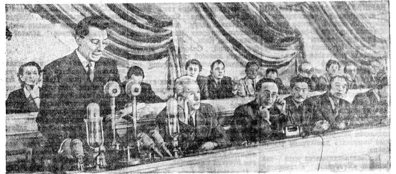
ВАРШАВА. Эб найрамдалай тала баригшад Бүхэдэлхэйн конгрессей Саг үргэлжэжэ комитетэй түрүүлэгшэ Жолио-Кюри конгресс нээжэ байна.