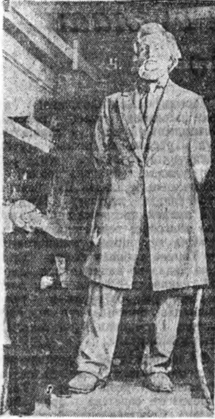
Ороной агуушха педагог К. Т. Ушинскийн яһа бараһаар 80 жэлэй ой январин 3-та гүйса. СССР-эй урвалхаһанай Академиян гэшүүв-корреспондент Сталинска шэнгай лауреат В. В. Лешев агүвхэ педагогий скульптурые хэжэ үүргэе. Зурга дээрэ: К. Т. Ушинскийн скульптурын дэргэдэ В. В. Лешев агүвхэ байба.

«Ямар тошолол хэгдэнэ? Гансал тошолол хэгдэнэ: бидэнэр зүб зам дээрэ байнабди, манай партиин политика зүб. Энэ замаар ябахыдаа, бүхэ ороһонод социализмын илаха ябадалда хээсээшье хүрэхэбди гэжэ тэрэнһэнэ ойгохо хэрэгтэй».